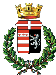
Comune di Gressoney Saint-Jean

La seconda stagione di “Monterosa racconta” presenta grandi narratori della scena letteraria contemporanea e approfondisce i temi della nostra attualità.